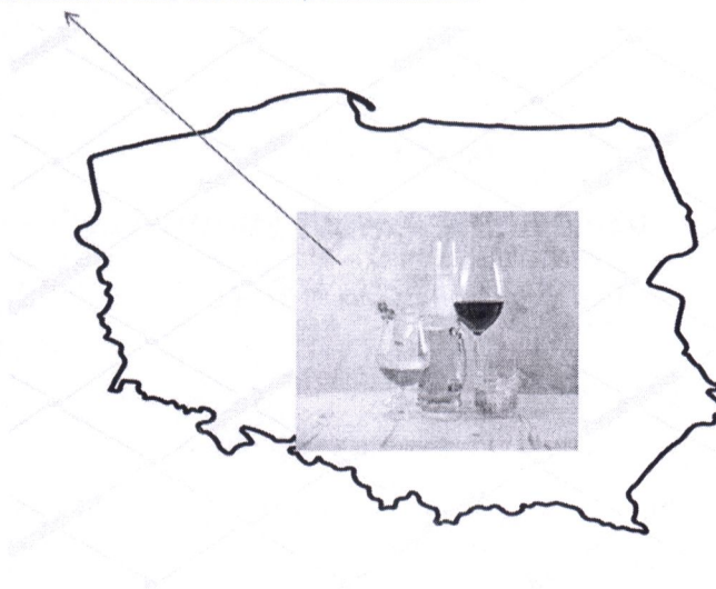
Spożycie alkoholu w Polsce w 2019 roku 9,78 litra/mieszkańca