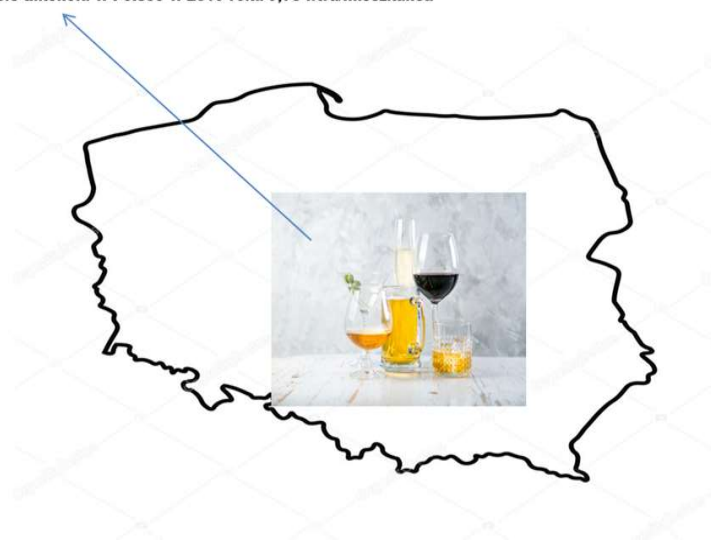
Spożycie alkoholu w Polsce w 2019 roku 9,78 litra/mieszkańca